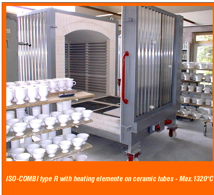
ISO-COMBI type R with heating elemente on ceramic tubes - Max.1320°C

Qualität und Beratung sind unsere Stärke und Ihre Sicherheit.