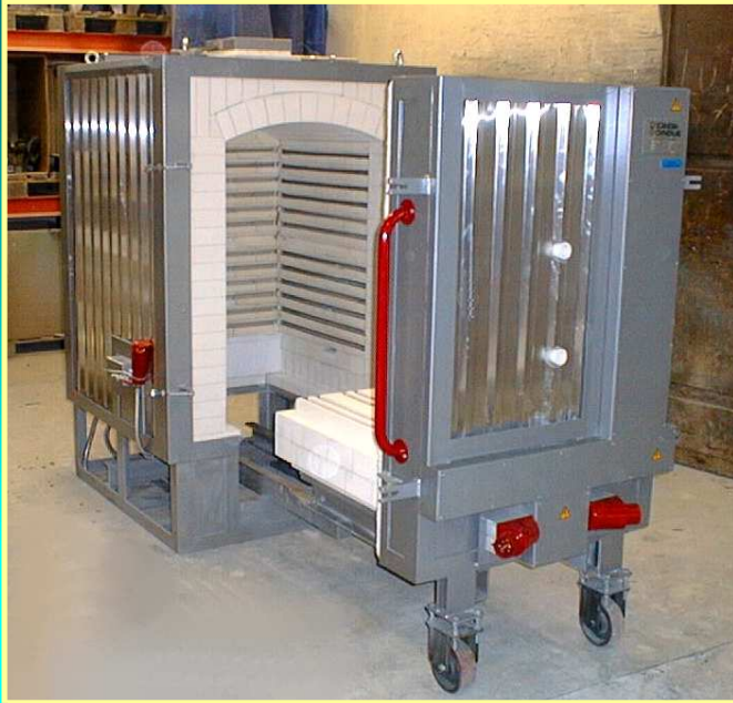
SCANDIA ISO-COMBI 500