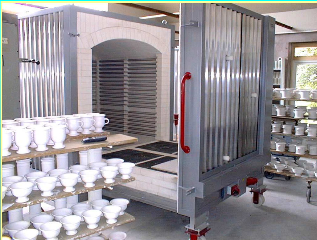
SCANDIA 2-ZONE ISO-COMBI 2100-R