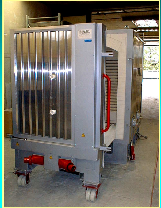
SCANDIA ISO-COMBI 1000