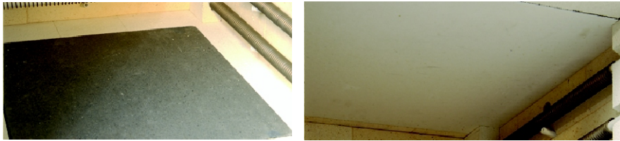
R-SIC dekke i tak og bunn hindrer dryss og beskytter elementene